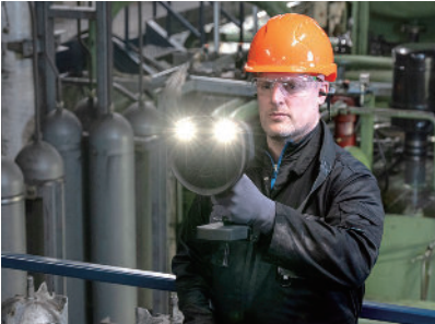
暗所の作業に強い作業用LED