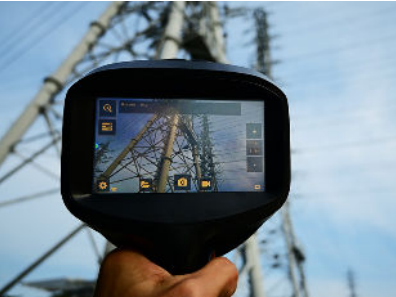
鮮明な画像で検査時間短縮