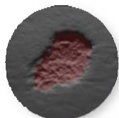
シャーシフレームのピット

ピットの数、カバー比、最小/最大の深さと直径などを高解像度且つ高精度で検出、測定、報告します。