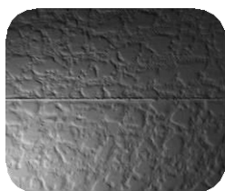
ステアリングホイールのパーティングラインと質感