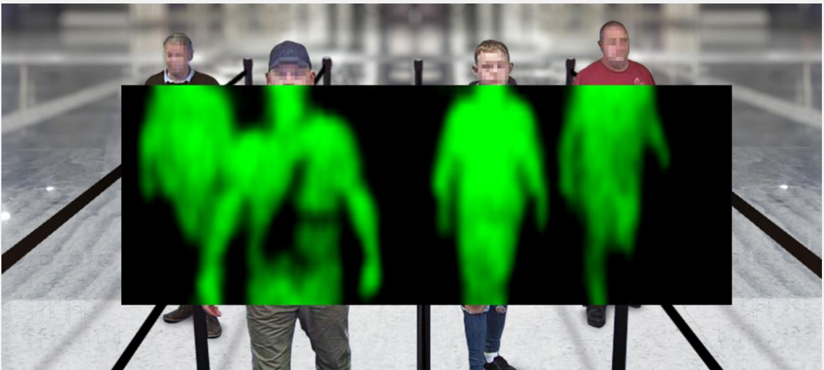
装置から6m先で最大4レーンの範囲の歩行者の大きな脅威物を検出

最大6メートルの距離で最大4レーンの歩行する来場者が隠し持つ大量の死傷者が発生する脅威物を安全に検出