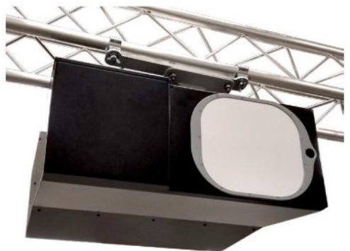
軽量のアルミニウムガントリーマウントで固定されたHTC16