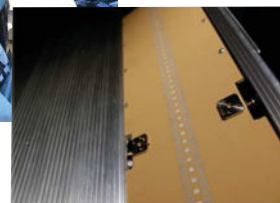
アンテナフィード