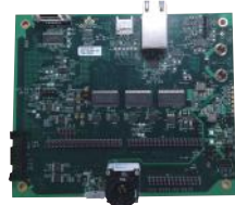
Development Board (P/N: 250-0593-00) 各種インターフェイス搭載開発キット