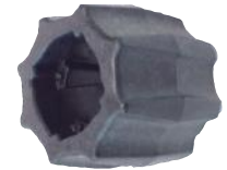
Lens focus tool (P/N: 261-2609-00) レンズフォーカス変更カスタムツール