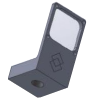
Tripod mount (P/N:261-2608-00) 1/40-20 インターフェイスの専用三脚